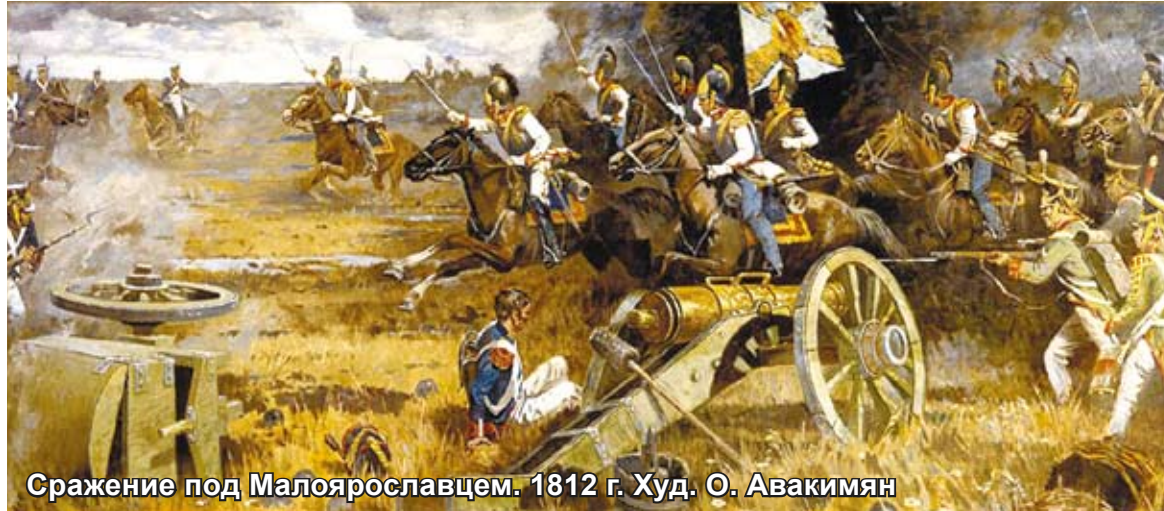
Сражение под Малоярославцем. 1812 г. Худ. О. Авакимян

А потом — Бородино. Ширванский полк оборонял знаменитую батарею Раевского . Потери нижних чинов среди защитников батареи составили